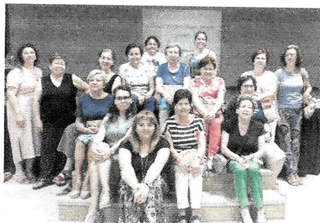
El Taller de autocuidados organizado por al Asociación "Entre Mujeres" dejó con ganas de repetir a las asistentes.