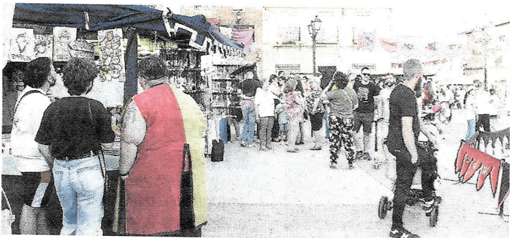
La feria medieval o la I Romería a caballo de Pantoja han sido dos de los eventos programados en el 'Mes cultural' pantojano.

En nuestra edición anterior ya os hicimos un pequeño resumen de las actividades a realizar entre las que han destacado, especialmente, talleres, como el organizado por la Asociación "Entre mujeres", en la sede de la asociación sobre el cuidado facial; las celebraciones del día de la madre o una gimkana familiar el día 30 de abril, fueron algunos de los primeros eventos de este 'mes cultural', una de las celebraciones culturales más amplias de la comarca de la Sagra, que comenzaba el día 22 de abril. Ya en mayo, talleres de primeros auxilios impartidos por protección Civil o un taller de 'comunicación asertiva y resolución de conflictos', este último impartido por el AMPA con la colaboración de una psicóloga, arrancaban la programación cultural del mes, llegando al día 7 y 8 en el que se celebraba un espectacular musical en la Casa de la Cultura, 'Jesus', interpretado