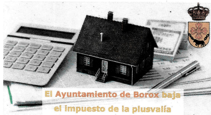
El Ayuntamiento de Borox baja el impuesto de la plusvalía

La ordenanza hasta ahora vigente fue aprobada hace 19 años y establecía un tipo de gravamen del 22% y no contemplaba ninguna bonificación. La nueva ordenanza prevé una bajada del tipo de gravamen desde 22% al 18%, además de incluir las bonificaciones máximas permitidas por la ley, de hasta el 95% para los casos de transmisión por herencia. Con la entrada en vigor de la reforma, los ciudadanos que vendan o hereden terrenos urbanos notarán un enorme alivio fiscal al momento de tener